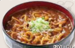
写真：カレーうどん