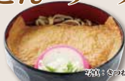
写真：かつねうどん