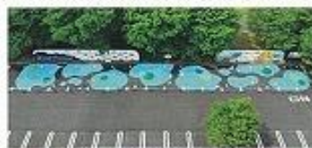
優秀賞を受賞したウェルカム広場

福島西高校デザイン科学科ビジュアルデザインコースの生徒の皆さんとともに公園大駐車場で行ったウェルカム広場づくりへの取り組みが、公園での自由な発想で実施した活動等を表彰する「公園夢プラン大賞2022」の優秀賞を受賞しました。混雑時以外は、駐車を避ける心理効果を狙って高校生がデザインしたもので、先輩たちが完成させたウェルカムボードと合わせて評価をいただいたものと思います。公園事務所では、これからも県民の皆様とともに新たな活動にチャレンジしていきます。