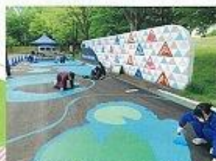
塗装作業を行う高校生の皆さん